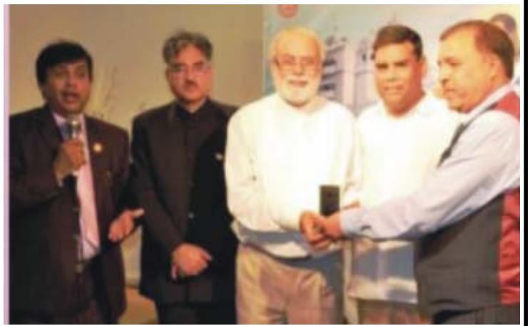
ਕਾਂਸ਼ੀ ਟੀ.ਵੀ. ਦੇ ਸਟੂਡੀਓ ਦੇ ਉਦਘਾਟਨ ਸਮੇਂ ਸਾਰਾ ਇਲਾਕਾ ਸਤਿਗੁਰੂ ਰਵਿਦਾਸ ਮਹਾਰਾਜ ਜੀ ਦੇ ਜੈਕਾਰਿਆਂ ਨਾਲ ਗੂੰਜ ਉਠਿਆ